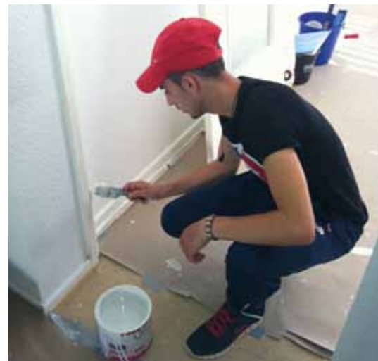
Das war kein Zuckerschlecken, sondern harte und fachmännische Arbeit – von der alle unsere Mieter in der Siedlung profitieren. Wir danken unseren Jugendlichen für ihren tollen Einsatz und der Firma Thomas Schmidt aus Offenbach für die Spende der Farbe.

Sechsmal haben sich rund 10 mutige junge Männer zum Stand-up-Paddeln auf hawaii-