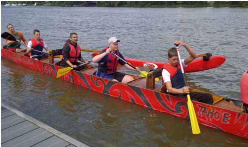
Immer schön im Rhythmus bleiben: Gemeinsames Paddeln auf dem Main war eine der vielen Sommeraktivitäten.

In der Offenbacher Hans-Böckler-Siedlung tut sich was. Die Jugendlichen haben das neue Kontaktbüro für alle Bewohner eigenhändig renoviert, die Aktivitäten werden überwiegend gut angenommen – und auch die Älteren wollen jetzt dabei sein. Rumpenheimer Straße 108: ein Ort, wo etwas entsteht.