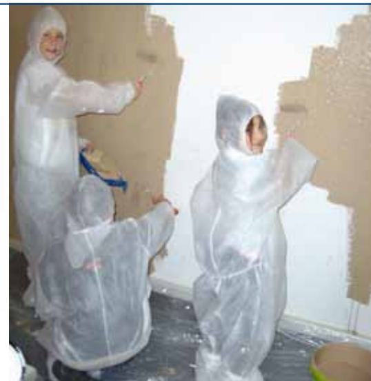
Große und kleine Nachbarn machen den Gemeinschaftsraum zu einem Ort, an dem man sich wohl fühlt.

Mit drei hauptamtlichen sowie 20 ehrenamtlichen Mitarbeitern und Honorarkräften bietet CASA e. V. – Centrum für aktivierende Stadtteilarbeit – ein vielfältiges Programm für jedermann. Da gibt es je einen eigenen Mädchen-, Jungen-, Jugend- und Frauentreff, Hausaufgabenhilfe, Deutschkurse, Gesundheits-, Foto- und Computerkurse, aber auch Projekte zu Kunst und