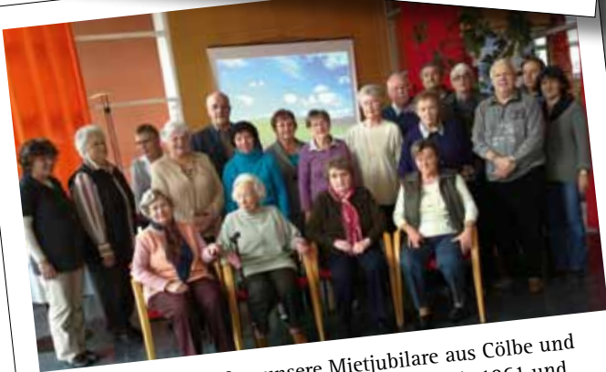
Fotos von früher ließen unsere Mietjubilare aus Cölbe und Marburg in Erinnerungen schwelgen. „So sah's 1961 und 1971 aus, als wir einzogen!“ Ein wunderbarer Nachmittag bei Kaffee und Kuchen im Restaurant Südseite. Vielen Dank für Ihre langjährige Mietertreue!