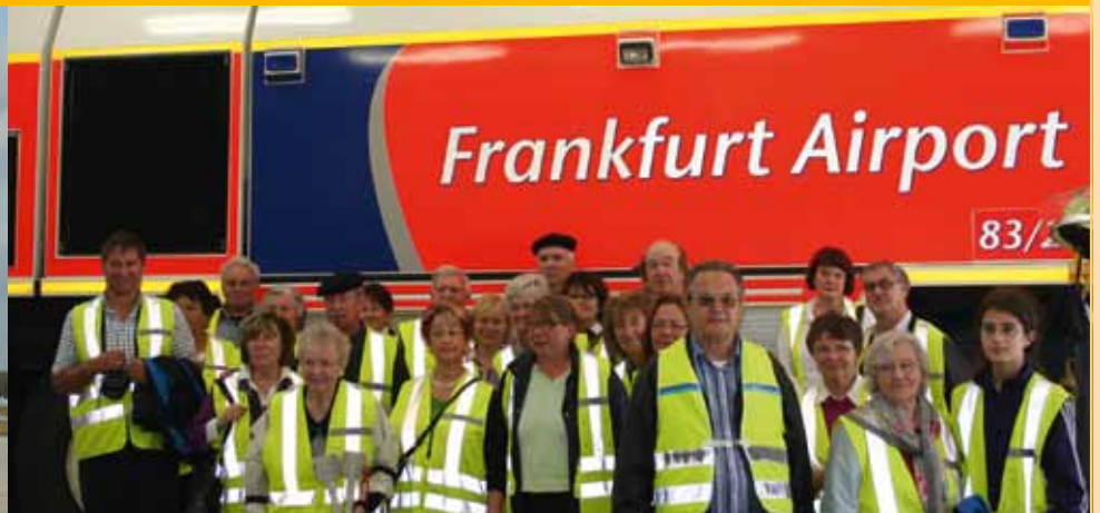
Rundfahrt über den Frankfurter Flughafen: Wir waren dabei – und das für schlappe 3 Euro!