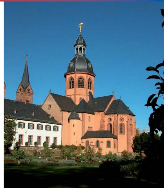
Einhard, der Kanzler von Karl dem Großen, begann um 830 mit dem Bau der Basilika, die bis heute das Stadtbild prägt.

Das war allerdings nicht immer so. Ende der 80er Jahre mehrten sich die Anzeichen, dass im Niederfeld ein Prozess der „Instabi-