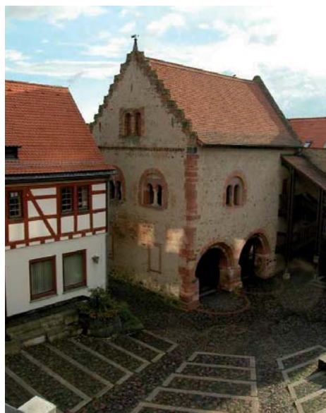
Die 1000-jährige Stadtgeschichte bietet viel zum Sehen und Entdecken.

lität und sozialen Ausgrenzung“ eintreten könnte. Das seit 1996 bestehende Bundes-Länder-Programm „Soziale Stadt – Stadtteile mit besonderem Entwicklungsbedarf“ erschien für Niederfeld wie maßgeschneidert. Im Jahr 2000 wurde es in die Förderung aufgenommen und seither hat sich einiges getan. Ziele des Programms sind unter anderem die Stärkung der Wirtschaft vor Ort, ein besseres soziales und kulturelles Leben im Stadtteil sowie die städtebauliche Stabilisierung.