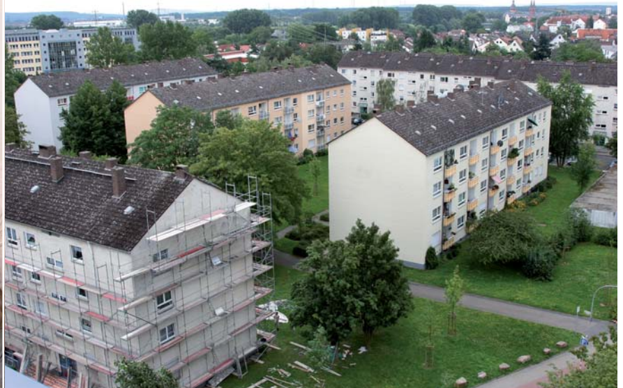
^ Bald erstrahlt auch der Rest der Siedlung in neuem Glanz.