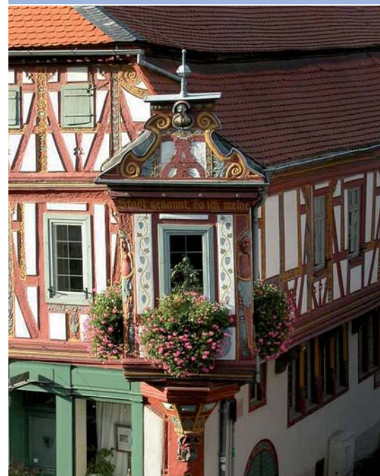
Liebevoller Details an den Fachwerkhäusern aus dem 17. und 18. Jahrhundert.