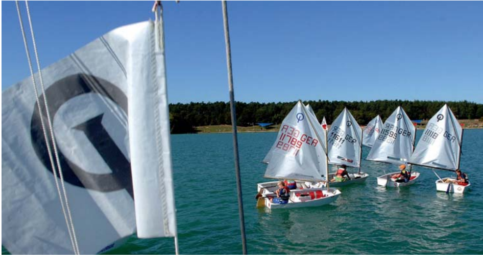
Der Langener Waldsee hat sich von der Kiesgrube zu einem der beliebtesten Freizeitzentren im Rhein-Main-Gebiet gemauert. Die Triathleten des Ironman steigen hier ins Wasser und bewältigen ihre 3,8 Kilometer lange Schwimmstrecke.

so haben etwa die Deutsche Flugsicherung und das Paul-Ehrlich-Institut ihren Sitz in Langen, aber auch die Mitarbeiter des Wetterdienstes werden hier ausgebildet. Ob sie es wohl sind, die in dem berühmten Drei-Sterne-Restaurant Amador ihre Geschäftskollegen zu ausgefallenen Menüs einladen, bei denen jeder einzelne Gang wie ein Kunstwerk präsentiert wird? Molekulare Küche eben. Das eröffnet auf bodenständige Gerichte wie „Strammer Max“ oder „Grüne Soße“ ganze neue Sichtweisen.