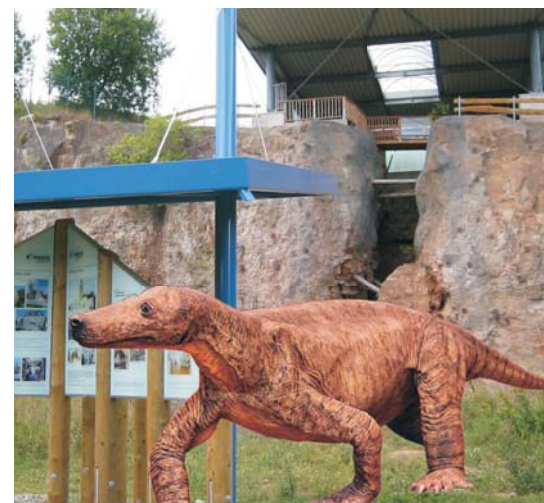
Fossilienfundstätte Korbacher Spalte: Hier lebten einst die Urahnen von Dinosauriern und Säugetieren, u. a. der berühmte Procynosuchus , im Volksmund auch „Dackel“ genannt.

Etwa 4 Kilometer (Luftlinie) südwestlich liegt Korbachs Hausberg, der 562 Meter hohe Eisenberg. Aus der Ferne betrachtet ragt er fast majestätisch wie eine Insel aus der Korbacher Hochfläche empor. Vom frühen Mittelalter bis zum Dreißigjährigen Krieg (1618–1648) entlockten Bergleute ihm insgesamt rund 1,2 Tonnen reines Gold und trugen damit wesentlich zur wirtschaftlichen