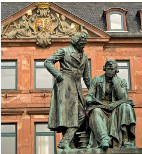
Was wäre eine Kindheit ohne die Märchen der Gebrüder Grimm? In Hanau aufgewachsen, widmet die Stadt ihnen ihre berühmten Märchenfestspiele.

Nicht mehr Gold, aber doch mehr Glanz für die Innenstadt ist das Ziel für die nahe Zukunft in Hanau. Denn hier hatte sich viele Jahre lang nichts getan. Mit einem groß angelegten, bundesweit beispiellosen Umbau soll eine Kette von fünf historischen Plätzen samt der sie verbindenden Straßen umgestaltet werden. Das zieht ein ganzes Bündel von Baumaßnahmen nach sich und soll mit einem geschätzten Aufwand von 150 bis 200 Millionen Euro verbunden sein. Um den richtigen Investor mit geeigneten Ideen zur Stadtentwicklung zu finden, läuft hierfür seit 2008 das europaweite Auswahlverfahren „wettbewerblicher Dialog“. Von acht Bewerbern wurden sieben zugelassen, fünf Konzepte wurden bisher vorgestellt. Seit Juni sind noch drei Investoren im Rennen. Ziel der Stadtumgestaltung ist, die Vielfalt und Lebendigkeit der Innenstadt zu stärken.