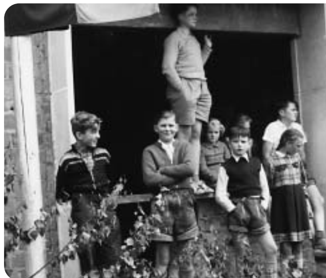
So ein großes Richtfest hatten sie noch nicht erlebt! Auch die Kinder der Siedlung freuten sich 1955 auf ihr schönes neues Zuhause.

eine solche Wohnung hatte, konnte sich damals glücklich schätzen, erinnern sich die Siedlungsbewohner heute. Auch ein 13 Stockwerke hohes Wohnhaus mit 90 1-Zimmer-Wohnungen sowie 117 später privatisierte Eigenheime entstanden zu dieser Zeit.