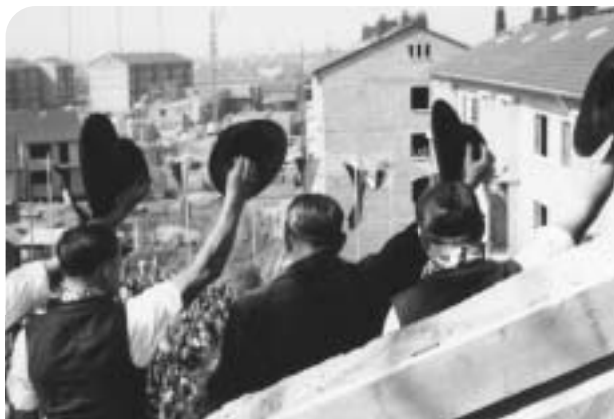
Richtfest für Frankfurts größtes Wohnquartier der Nachkriegszeit. Hoch auf den Dächern grüßen die Zimmerleute die künftigen Bewohner.