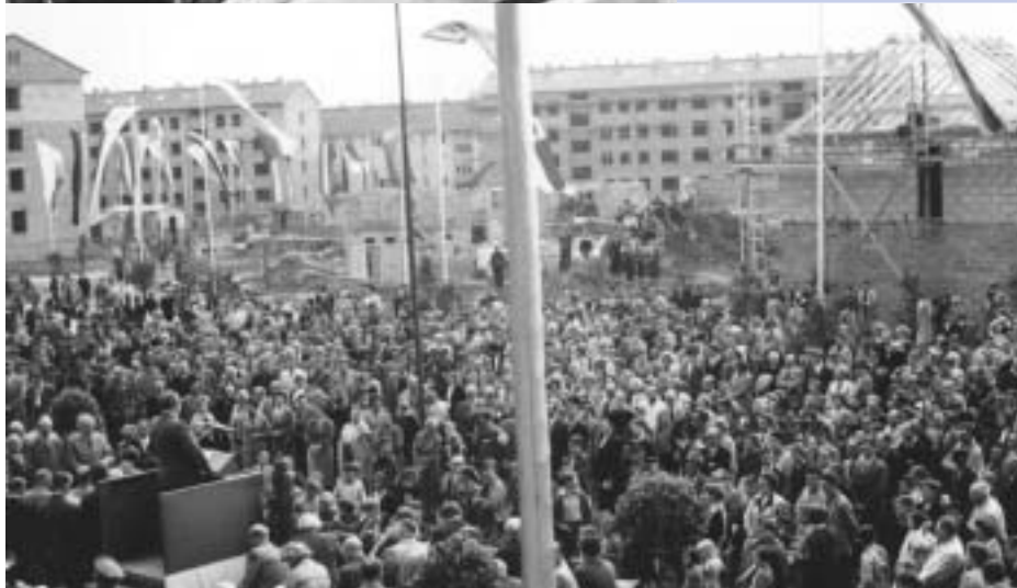
Gespannt lauscht die Menschenmenge der Eröffnungsrede des damaligen Hessischen Innenministers Heinrich Schneider. Einige Wohnhäuser sind noch im Rohbau.