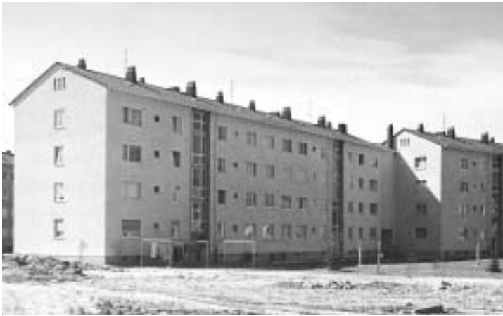
1955: Kaum bezugsfertig, sind die Wohnungen rasch vergeben.

Als Nierentisch und Goggomobil modern waren, aber auch die Wohnungsnot am stärksten, hat die Nassauische Heimstätte Frankfurts größte Wohnsiedlung der Nachkriegszeit gebaut. Jetzt feierte sie mit ihren Mietern das 50-jährige Jubiläum der Albert-Schweitzer-Siedlung.